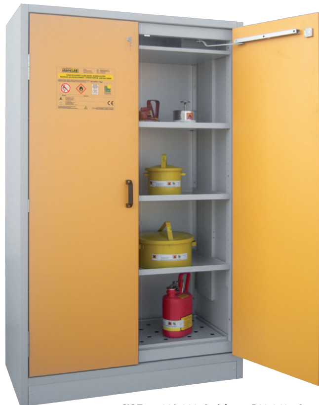
SIS Type 30/1200, Article no. B80-2604-A, doors RAL 1007 - daffodil yellow, incl. 3 shelves, base sump tray and perforated cover plate