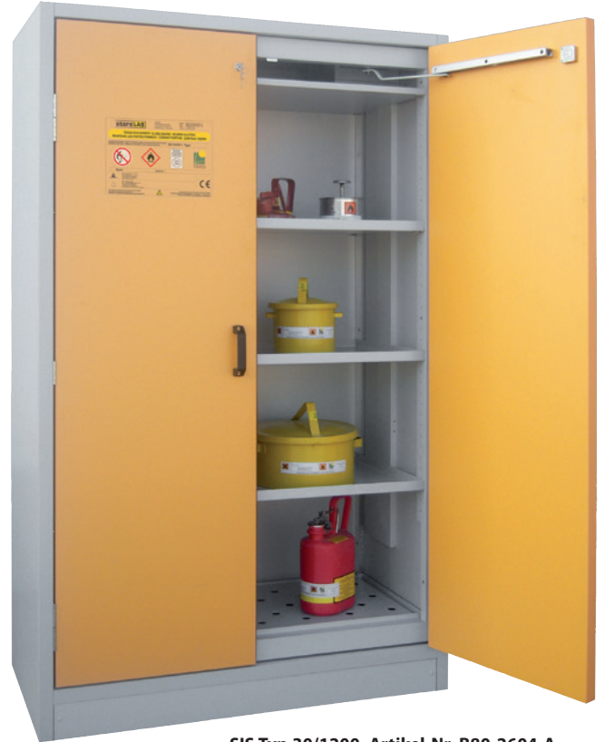
SIS Typ 30/1200, Artikel-Nr. B80-2604-A, Türen RAL 1007 - narzissengelb, inkl. 3 Einlegeböden, Bodenwanne und Lochblechabdeckung