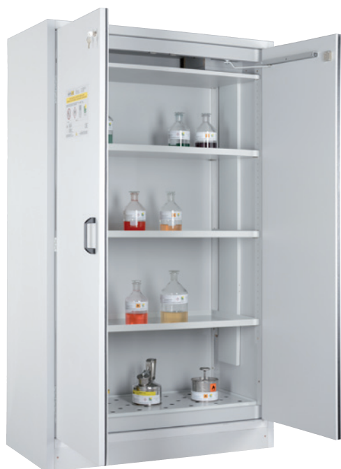
SIS Type 30/1200, Article no. B80-2600-A, doors RAL 7035 - light grey, incl. 3 shelves, base sump tray and perforated cover plate