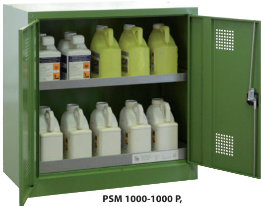
PSM 1000-1000 P, Artikel-Nr. B80-6556-A