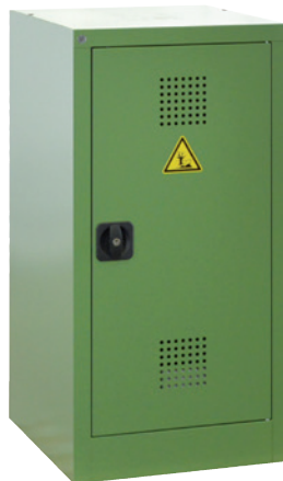
PSM 500-1000 P, Article no. B80-6554-A