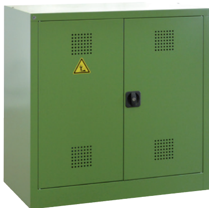
PSM 1000-1000 P, Article no. B80-6556-A