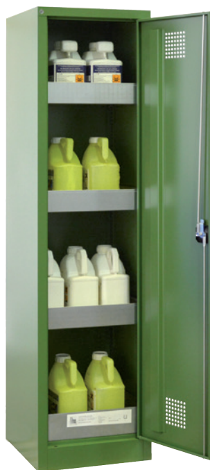
PSM 500 P, Article no. B80-6555-A