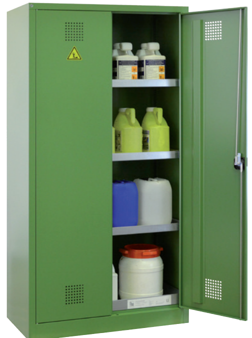
PSM 1000 P, Artikel-Nr. B80-6557-A