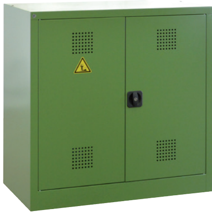
PSM 1000-1000 P, Artikel-Nr. B80-6556-A