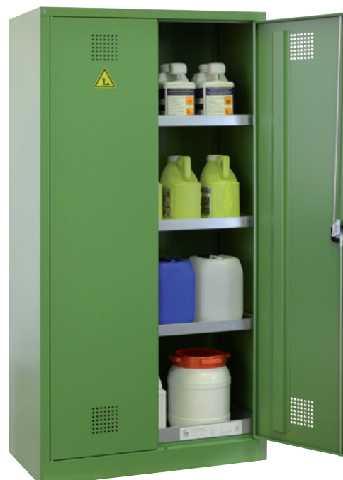
PSM 1000 P, Article no. B80-6557-A