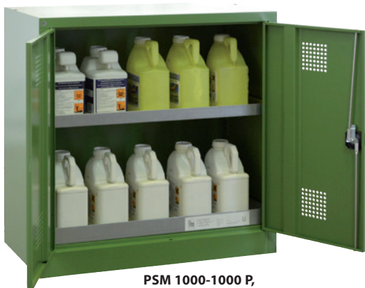
PSM 1000-1000 P, Article no. B80-6556-A