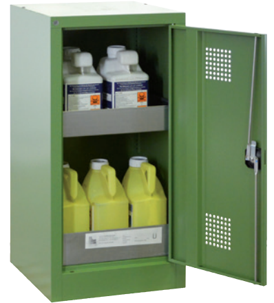
PSM 500-1000 P, Artikel-Nr. B80-6554-A