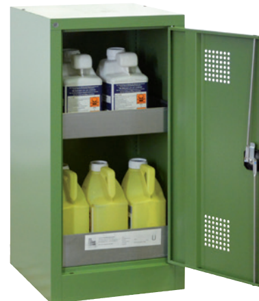
PSM 500-1000 P, Article no. B80-6554-A