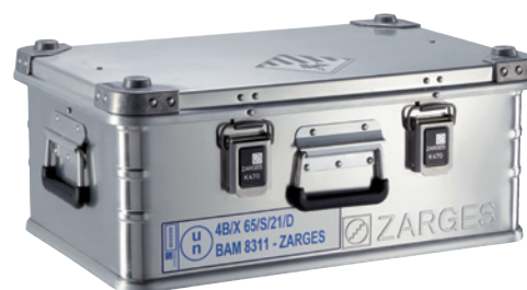
Transport box K 470 - Akku Safe Universal, Article no. C62-2071-B