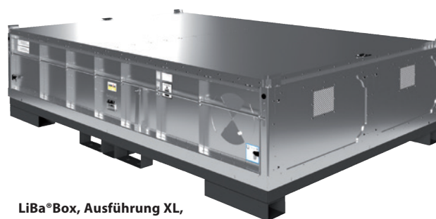
LiBa®Box, Ausführung XL, Artikel-Nr. C62-2082-B