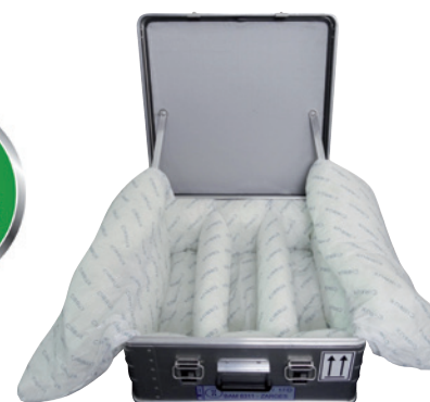
Transport box K 470 - Akku Safe, Article no. C62-2070-B