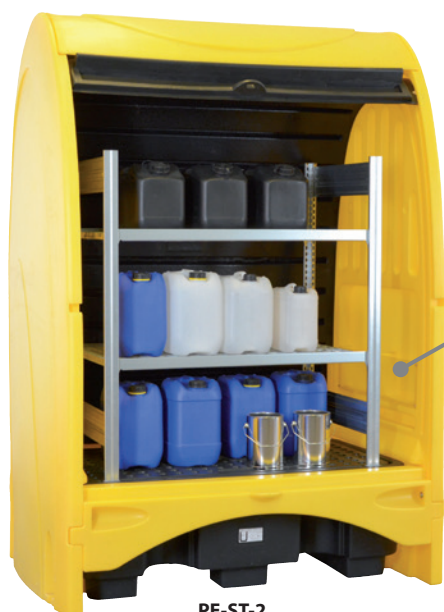
PE-ST-2, Article no. P70-2052-A, with optional shelf set