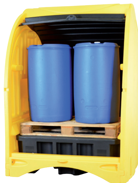
PE-ST-45, Article no. P70-2054-A