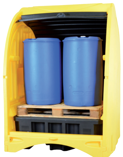
PE-ST-45, Artikel-Nr. P70-2054-A