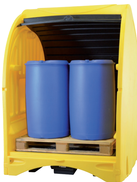
PE-ST-4, Article no. P70-2053-A