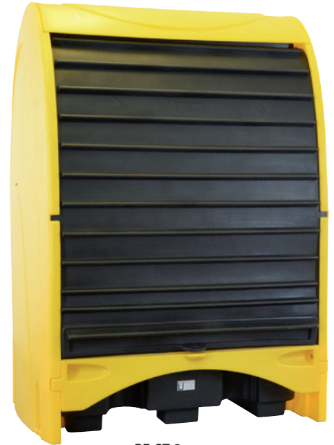
PE-ST-2, Artikel-Nr. P70-2052-A