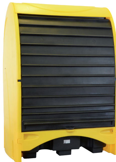
PE-ST-2, Article no. P70-2052-A